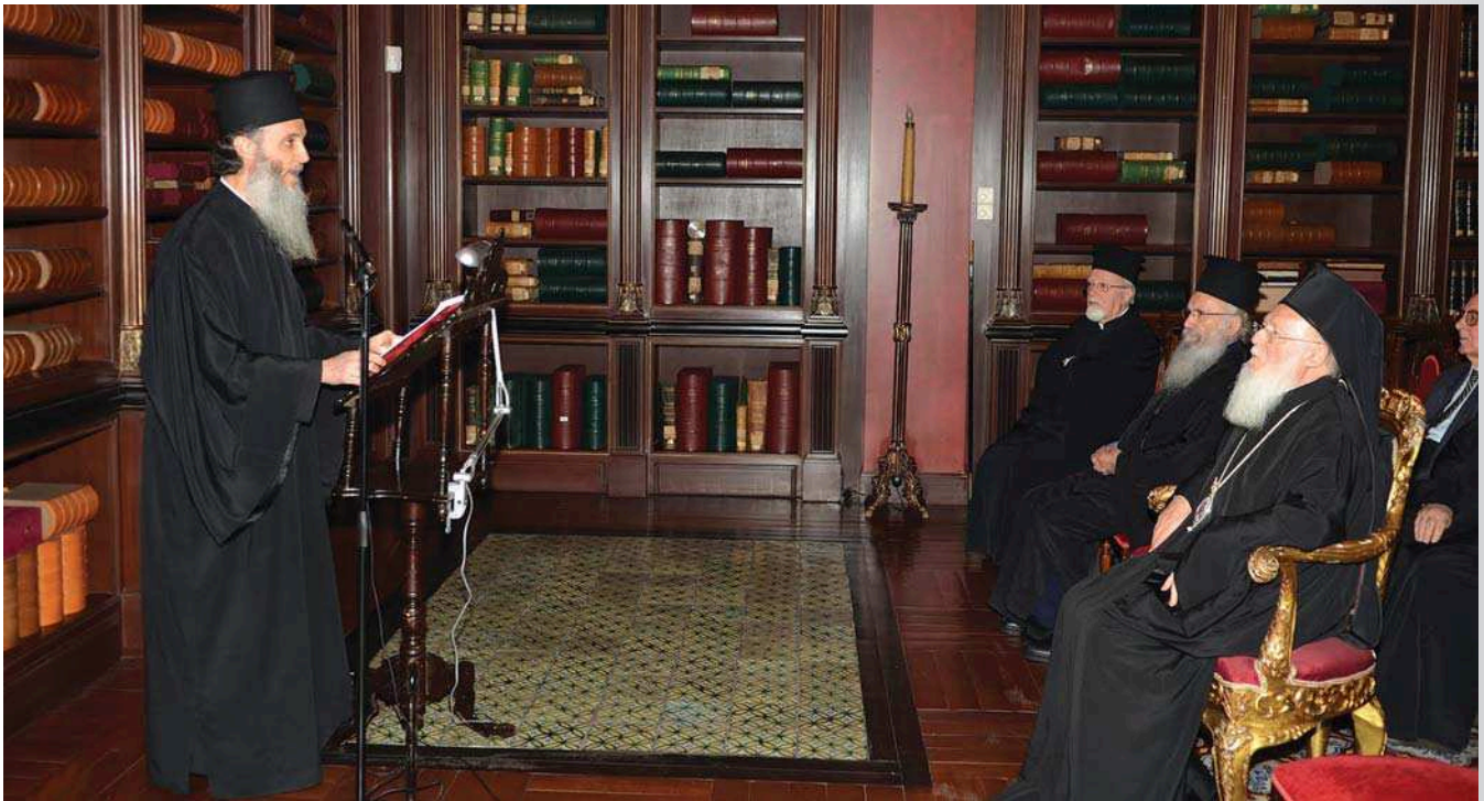
Ὁ Σεβ. Μητροπολίτης Κορέας κ. Ἀμβρόσιος ἐκφωνεῖ τὴν ὁμιλίαν ἐνώπιον τοῦ Παναγιωτάτου Οἰκουμενικοῦ Πατριάρχου κ. Βαρθολομαίου καὶ Μελῶν τῆς Ἱερᾶς Συνόδου.

ναμη τῆς ὁμαδικῆς προσευχῆς τῶν παιδιῶν “ἐπ’ ἐκκλησίας”. Ἔτσι πρῶτὴ καὶ βράδυ στό εἰδικό αίτημα τοῦ ἱερέα: “Ἦπερ ὑγείας τοῦ δούλου τοῦ Θεοῦ Σωτηρίου...” οἱ κατασκηνωτές ὁμοθυμαδὸν ἔκραζαν πρὸς τὸν Θεό τὸ “Τσουγιό Πουλισανχί Γιokισσό = Κύριε, ἐλέησον”. Πρὸς τὸ τέλος τῆς κατασκίνωσης ἔφθασε ἡ χαρμόσυνη πληροφορία ὅτι ὁ Σωτήρης ἀνάνηψε ἀπὸ τὸ κῶμα καὶ βγήκε ἀπὸ τὴν ἐντατική. Τὸν ἐπισκεφθήκαμε σέ κανονικό δωμάτιο καὶ τοῦ μεταδώσαμε τὴν θ. Κοινωνία. Ἡ μητέρα του μᾶς εἶπε πὼς οἱ γιατροὶ δὲν πίστευαν στὴν τροπὴ πού πήρε τὸ πρόβλημα τῆς ὑγείας τοῦ παιδιοῦ της. Ἡ ἴδια πίστευε πὼς ἔγινε θαῦμα!