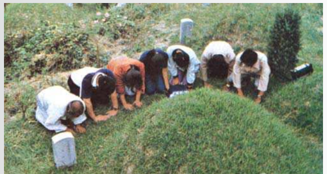
Κορεάτες εκδηλώνουν τον σεβασμό τους, με τον παραδοσιακό τους χαιρετισμό, μπροστά στον τάφο συγγενούς τους.

8. Σύμφωνα με τά έπίσημα στατιστικά στοιχεία τό έτος 2010 στην Κορέα αυτοκτόνησαν 15.413 άνθρωποι. Έξ αυτών 9.936 ήσαν άνδρες και 5.477 γυναίκες. Αυτό που προκαλεί μεγάλο προβληματισμό και πραγματικό άποτροπιασμό είναι τό γεγονός ότι τό 2010 αύξηθηκαν κατά 47% οι αυτοκτονίες των νέων, μαθητών δευτεροβάθμιας και τριτοβάθμιας έκπαίδευσης. Συνοχικά αυτοκτόνησαν τό 2010 146 μαθητές. Έξ αυτών 46 (31.5%) μαθητές αυτοκτόνησαν εξ αιτίας προβλημάτων στην οικογένειά τους, ενώ 38 (26%) μαθητές έθεσαν τέρμα στην ζωή τους για άδιευκρίνιστες αιτίες. Άλλοι λόγοι, που οδηγούν συνήθως τά παιδιά στην αυτοκτονία είναι η κακή βαθμολογία, η έρωτική άπογοήτευση και τά οικονομικά προβλήματα στην οικογένειά τους (βλ. The Korean Times , 2-2-2011).