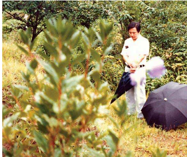
Τρισάγιο στόν τάφο ὀρθόδοξου Κορεάτη, στό Κοιμητήριο τῆς ἐν Κορέᾳ Ἐκκλ.

Ὁ τρόπος καύσης τῶν νεκρῶν πού περιγράψαμε ἔχει γίνει μέ τήν σύγχρονη τεχνολογία ὑπόθεση πατήματος ἠλεκτρικῶν κουμπιῶν. Γι' αὐτό τόν λόγο θά μπορούσε ἴσως νά ἰσχυρισθεῖ κανεῖς ὅτι δέν ἔχει τήν φρίκη, πού παρουσιάζει ἡ καύση τῶν νεκρῶν πάνω σέ στιβάδα ξύλων εἰς κοινήν θεά στήν πλταία τοῦ χωριοῦ μέ τήν μυρωδιά τοῦ ψημένου κρέατος τοῦ νεκροῦ ὅπως π.χ. στήν Ἰνδία καί σ' ἄλλες χώρες τῆς Νοτιοανατολικῆς Ἀσίας, πού ὑπολείπονται σέ τεχνολογία καί ἀνάπτυξη. Ὅμως τό μέγιστο πρόβλημα παραμένει τό ἴδιο. Ἡ ὄλη διαδικασία ἀποτέφρωσης, μέ τόν προηγμένο ἢ τόν πρωτόγονο τρόπο, εἶναι τό ἴδιο μηδενιστική. Κι αὐτή ἀκριβῶς ἡ μηδενιστική ἀντίληψη περί ζωῆς πού περικληῖει, ἐρμηνεύει γιατί